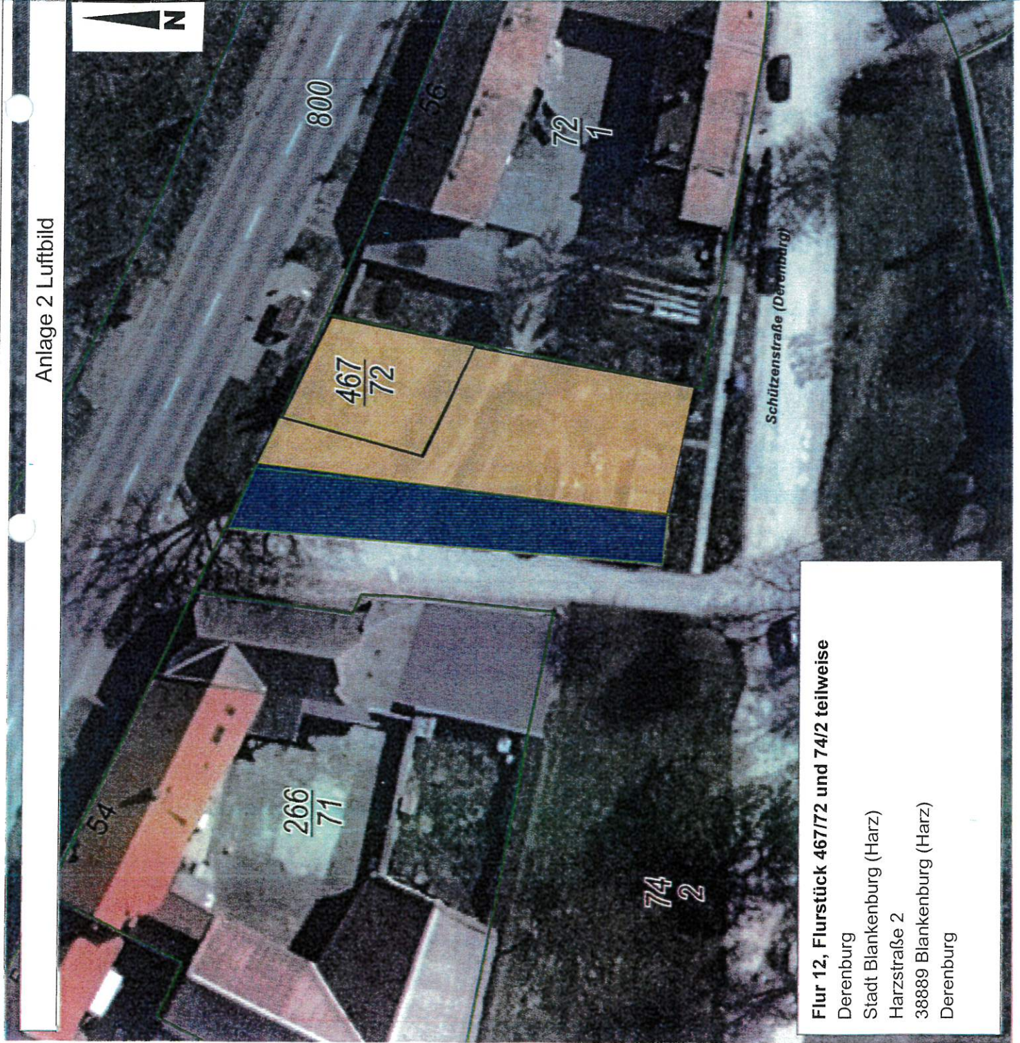
Anlage 2 Luftbild

Flur 12, Flurstück 467/72 und 74/2 teilweise