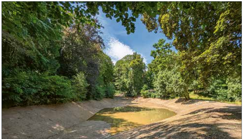
Der frisch sanierte Schlossteich wird unter anderem durch Niederschlagswasser vom Großen Schloss gespeist und läuft nun nach und nach voll.

Ein weiterer wichtiger Aspekt war die Einrichtung einer Löschwasserentnahmestelle, die im Ernstfall von der Feuerwehr direkt angefahren werden kann. Auch ein neues Schachtbauwerk mit naturnaher Ablaufgestaltung wurde errichtet, ebenso wie ein Durchlass zur kontrollierten Zuleitung von Hangwasser.