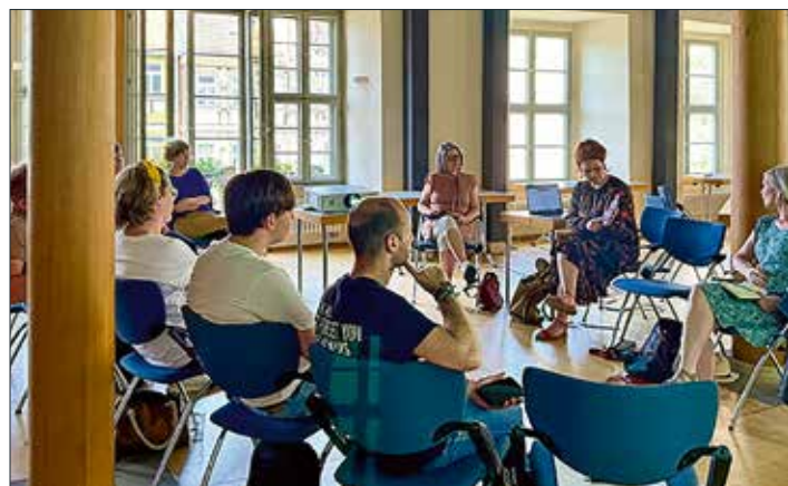
Auftakt kultur.bilden im Ratssaal

Für den Spätsommer ist eine Folgeveranstaltung mit Fördermittelberatung geplant. Termine werden rechtzeitig auf den Webseiten der beteiligten Vereine veröffentlicht.