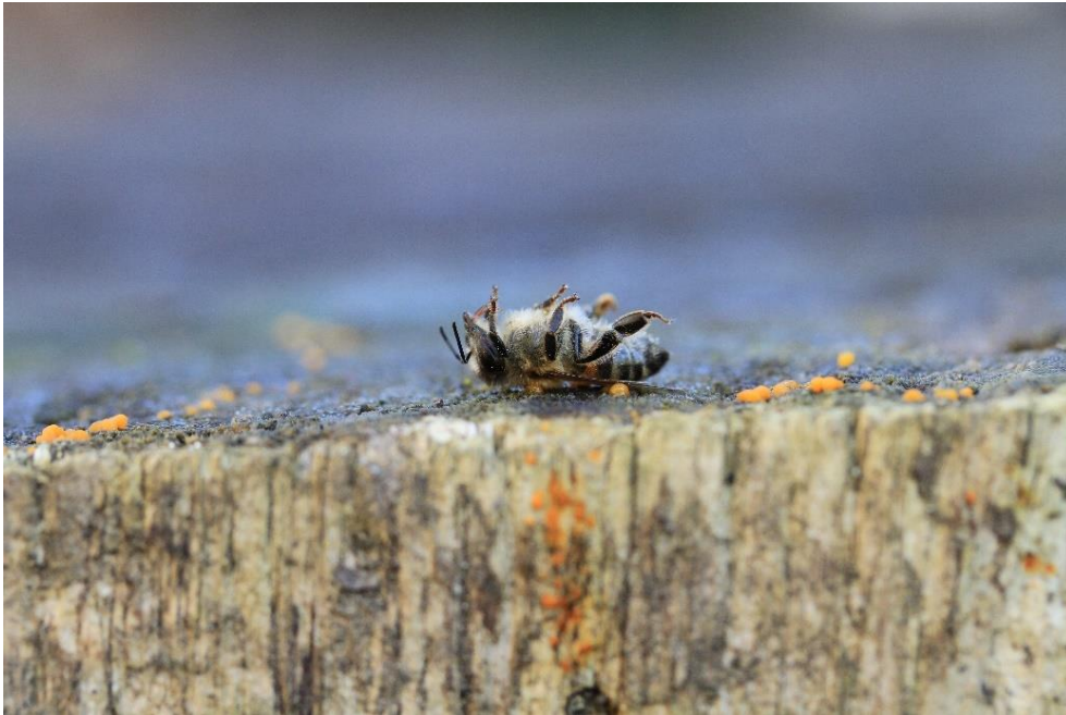
Tote Biene.

Um Nützlinge zu schützen, zu stärken und zu fördern, ist es unabdingbar, auf zerstörende Praktiken zu verzichten.