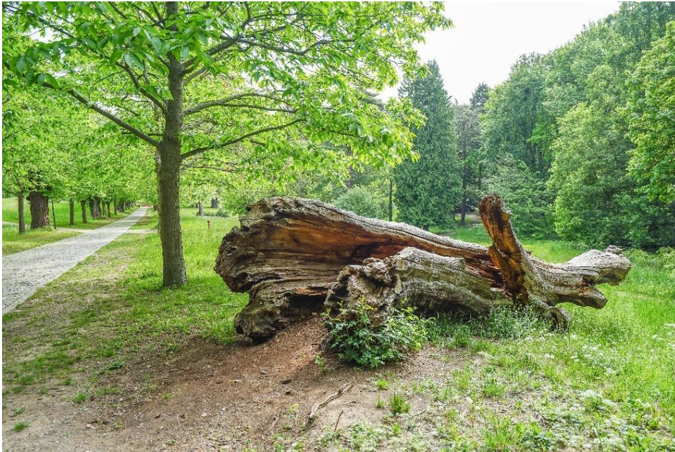
Lebensraum Baum: Abgestorbene Esskastanie im Blankenburger Schlosspark.

Bäume prägen das Stadtbild, verbessern das Stadtklima und filtern Stäube und Schadstoffe aus der Luft. Für viele Tierarten wie Insekten, Vögel, Fledermäuse und Eichhörnchen bieten sie Lebensräume, Nistplätze, Schutz und Nahrung.