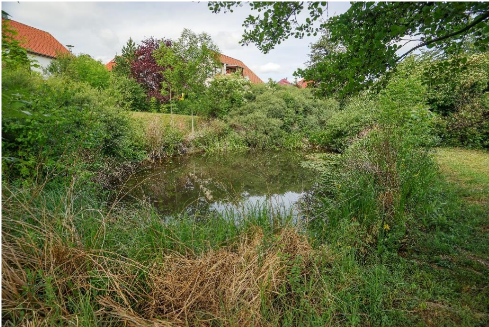
Biotop im Ortsteil Heimburg

Uferbereiche sind das häufig missachtete und unterschätzte Bindeglied zwischen Gewässern und deren angrenzende Kulturlandschaft. Ihnen obliegen vielfältige ökologische Funktionen, wie Lebensraum für Tiere und Pflanzen, Nahrungsquelle und Überwinterungsquartier. Vögel nutzen es als Rast- und Brutraum, für Amphibien sind sie lebensnotwendig als Lebensraum nach der Entwicklung im Wasser und auch Reptilien zählen zu den Bewohnern.