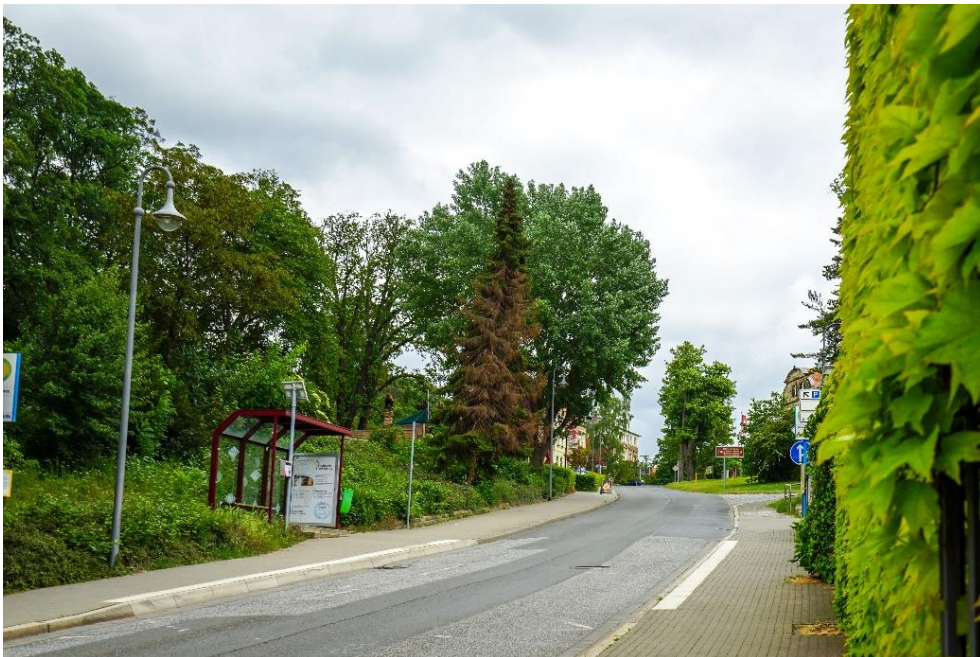
Sträucher im Stadtbild

Sträucher und Hecken können nicht nur ästhetisch sein. Sie haben auch eine große Bedeutung für den Haushalt der Natur. Im Schutz einer Hecke bildet sich ein günstiges Mikroklima. Bei richtiger Pflege filtern sie Staub, Schmutz und schädliche Abgase, und wirken außerdem lärmdämpfend. Sie bieten zudem einen Schutz vor negativen Witterungseinflüssen und gleichzeitig einen Lebensraum für zahlreiche Tiere.