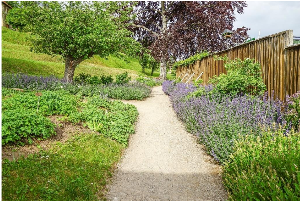
Eingang zum denkmalgeschützten Berggarten.

Gärtnerisches Grün bietet umfangreiche Möglichkeiten, mit gestalterischen Maßnahmen ästhetische, aber auch nützliche Aspekte zu vereinen.