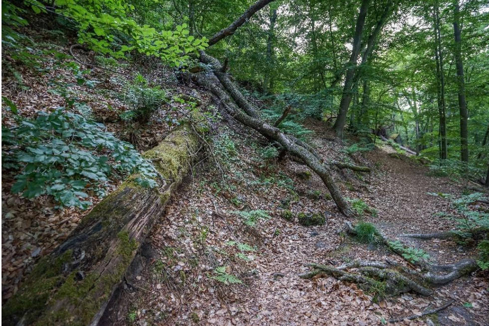
Sukzessionsflächen im Stadtwald Teufelsmauer.

Viele kleinteilige Maßnahmen sind die Grundlage zur Förderung der Artenvielfalt und Steigerung der Lebensqualität in der Stadt. Es gilt, funktionale Zusammenhänge zu betrachten und geeignete weitere Maßnahmen daraus abzuleiten.