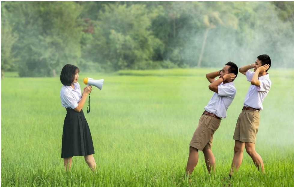
Öffentlichkeitsarbeit und Sensibilisierung.

Um ein nachhaltiges Handeln zu erreichen, ist es essentiell, alle Beteiligten – aus Politik, Verwaltung und Gesellschaft – frühzeitig zu beteiligen und im Prozess mitzunehmen. Das „Missionsziel“ und die „Marschroute“ muss allen bekannt sein. Auch das notwendige „Rüstzeug“ muss mitgegeben werden.