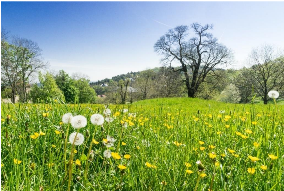
Wiese im Blankenburger Schlosspark.

Außerdem werden Totholz sowie Baumspalten und -höhlungen kartiert, die wichtige Lebensräume und Schutz für Insekten, Vögel und Fledermäuse bieten.