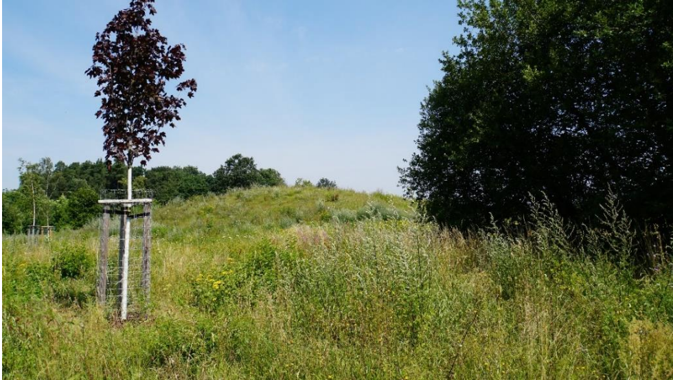
Park der Generationen.

Rasen und Wiesen bilden den flächenmäßig größten und bedeutsamsten Anteil städtischer Grünflächen. Dabei unterliegen sie unterschiedlichsten Nutzungen und entsprechenden Anforderungen, wie zum Beispiel Zierrasen, Spielwiesen, Park- und Sportanlagen.