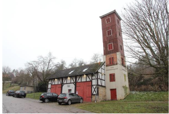
■ Westseitige Gebäudeansicht