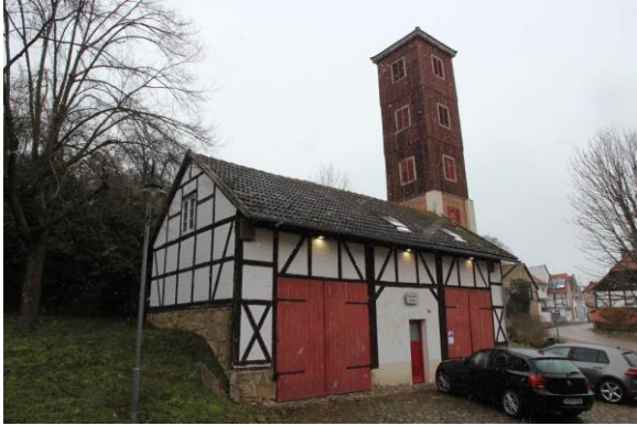
■ Ostseitige Gebäudeansicht