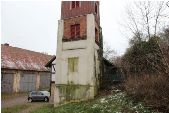
■ Nordseitige Gebäudeansicht