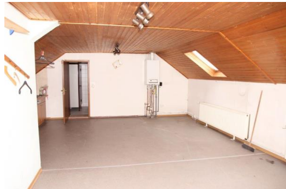
■ Raum im Dachgeschoss